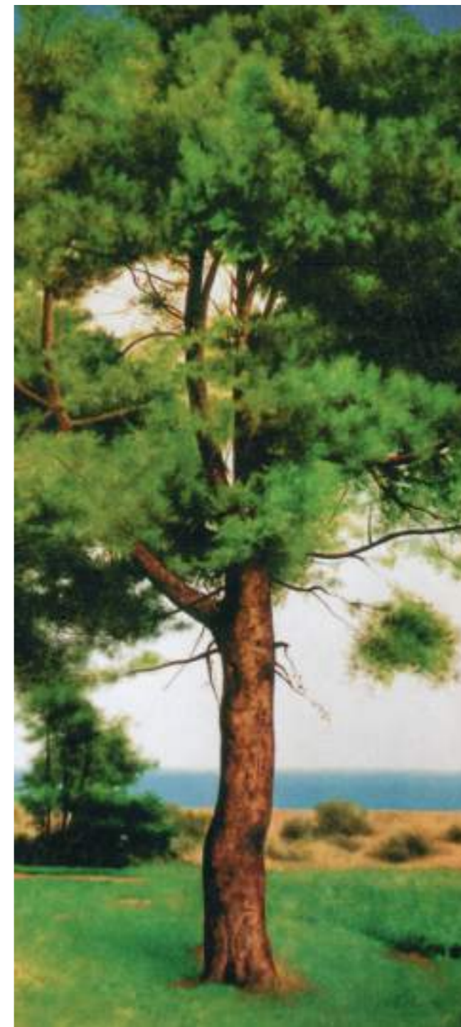
"Sulle rive del mare in cui ricomincia la vita", 1996, olio, cm 80x60 (part.)

Si tratta di opere in cui vive perfettamente quel "realismo simbolico" cui abbiamo sopra accennato, e non solo nei