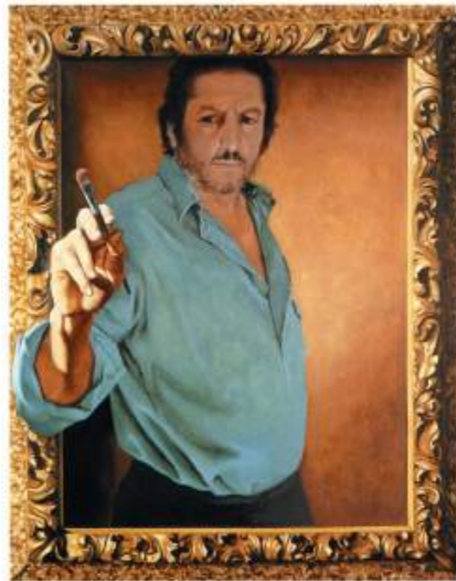
Autoritratto come Zeusi, 1993, olio, cm 100x80

Hanno partecipato al “10th International Music Competition SVIREL” (2018), conseguendo il Terzo Premio (Medaglia di Bronzo; punteggio 89/100) nella categoria Professionisti.