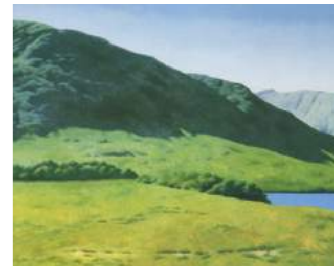
"Così verde del verde di una volta", 1998, olio, cm 72x95

ritratti di Pasolini – specie nel Poeta assassinato , figura enigmatica e funebre, ma come appagata in un accenno di sorriso, emergente dalla strana nitidezza di un sogno, da un irraggiungibile aldilà; e poi nell' Enigma della luce , un Pasolini con la maschera di Agamennone che interpreta, del poeta, tutta la misteriosa densità esistenziale; – ma anche, e direi soprattutto, nei paesaggi inventati a partire da testi pasoliniani, come ad esempio in Contro luce e di taglio , dove giocano tra loro magistralmente la luce che si distende sull'erba e accarezza appena il dorso degli alberi, e l'ombra che si addensa sul fondo, creando un clima di sospensione, un palcoscenico in cui qualcosa sembra dover accadere; oppure in Il mio linguaggio diventerà muto , sapientissima, tesa variazioni di verdi che tanto più prende, proprio perché non ha un centro, e scala verso l'alto finendo in un oscuro fitto di vegetazione che confina con l'impassibilità del cielo: quotidianità, e nello stesso tempo imperscrutabilità della visione.